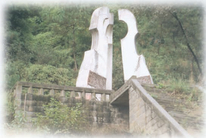
“国立音乐院”旧址纪念碑——重庆市沙坪坝区青木关