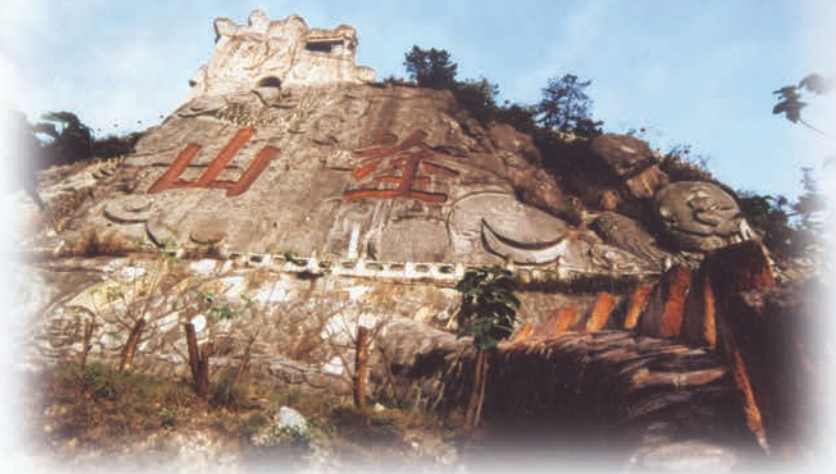
传说中“音乐的萌芽”之地——重庆市南山风景区涂山